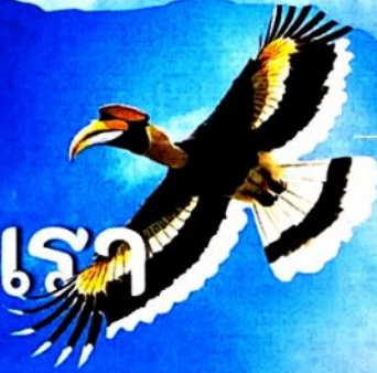
นกเงือก ... ป่าชาลาบาลา