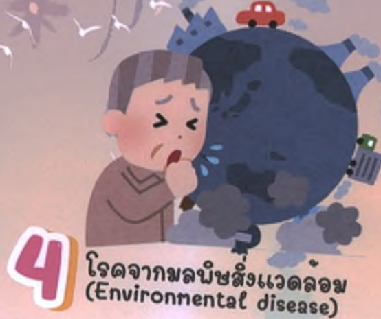
4 โรคจากมลพิษสิ่งแวดล้อม (Environmental disease)