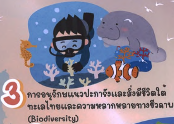
3 การอนุรักษ์แนวปะการังและสิ่งมีชีวิตใต้ทะเลไทยและความหลากหลายทางชีวภาพ (Biodiversity)