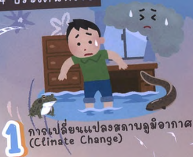
1 การเปลี่ยนแปลงสภาพภูมิอากาศ (Climate Change)