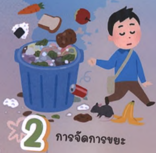
2 การจัดการขยะ