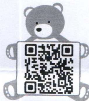
การให้บริการความรู้