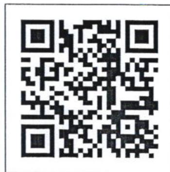
สแกนเพื่อส่งใบสมัคร