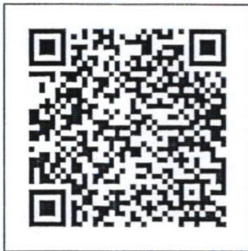
สแกนเพื่อดาวน์โหลดใบสมัคร และระเบียบการแข่งขัน