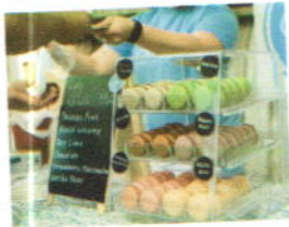
อาหาร ขนม และ เครื่องดื่มมากมาย