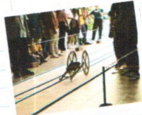
กิจกรรมแข่งขันรถ บรรทุกใบ