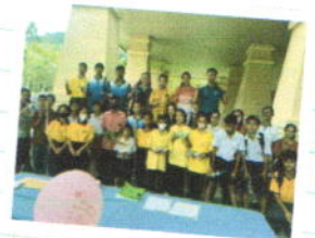
กิจกรรม แข่งขันเรือขุดน้ำ