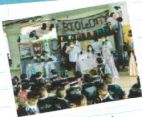
นิทรรศการต่างๆ