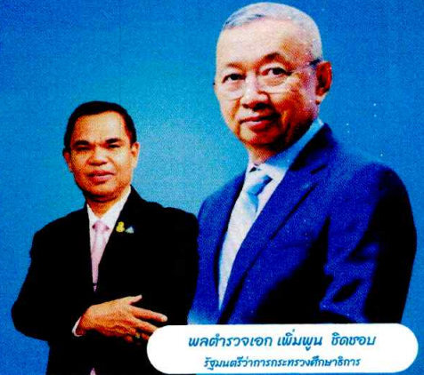
พลตำรวจเอก เพิ่มพูน ชิดชอบ รัฐมนตรีว่าการกระทรวงศึกษาธิการ

พร้อมรับโล่และเกียรติบัตร สำหรับรางวัลอื่น ๆ จะได้รับเกียรติบัตร