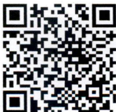
เอกสารองค์ความรู้

QR Code สำหรับการเข้าร่วมประชุมสัมมนาฯ ผ่าน Facebook Live: ร่วมปฏิรูปการศึกษาไทย ในวันพฤหัสบดีที่ ๓๐ พฤษภาคม ๒๕๖๗ เวลา ๑๓.๓๐ – ๑๖.๐๐ น.