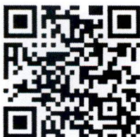
FB: ร่วมปฏิรูปการศึกษาไทย

QR Code แผ่นประชาสัมพันธ์การประชุมสัมมนา “เวทีนวัตกรรมการจัดการเรียนรู้ : Active Learning ประสบการณ์จริงจากสถานศึกษา”