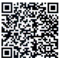
แผ่นประชาสัมพันธ์

QR Code กำหนดการประชุมสัมมนา “เวทีนวัตกรรมการจัดการเรียนรู้ : Active Learning ประสบการณ์จริงจากสถานศึกษา” ในวันพฤหัสบดีที่ ๓๐ พฤษภาคม ๒๕๖๗ เวลา ๑๓.๓๐ – ๑๖.๐๐ น.