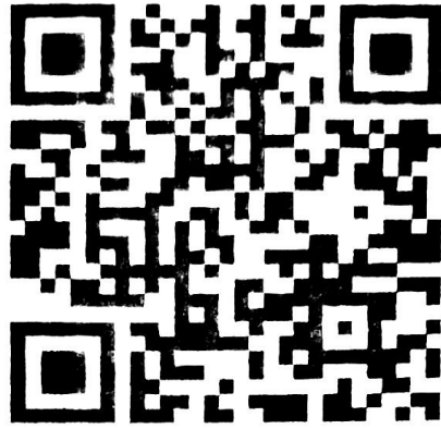
ประกาศรับสมัคร